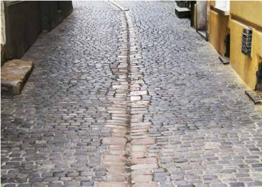
2 Abwassergraben in der Mitte einer Gasse in Regensburg.

doch immer einen Viertel seines Trinkwassers durch Wein ersetzte. 24 Zusammenfassend kann man sagen, dass Wein nicht nur ein unverzichtbares Lebensmittel des täglichen Bedarfs, sondern sogar ein Überlebensmittel darstellte.