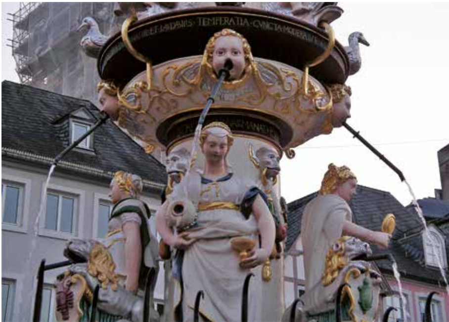
1 Allegorische Darstellung der Temperantia am Petrusbrunnen (Hans Ruprecht Hoffmann, 1594/95) auf dem Hauptmarkt von Trier.

auch erschwinglich. Dass man Wein aber nicht ungewässert trinken solle, auch dort nicht, wo er günstig und in Hülle und Fülle vorhanden ist, legte den mittelalterlichen Menschen eine der vier Kardinaltugenden nahe: Temperantia, die Tugend der Mässigung, wird allegorisch immer mit Wasserkrug und Weingefäss dargestellt, zum Beispiel am berühmten Marktbrunnen der Weinstadt Trier (Abb. 1).