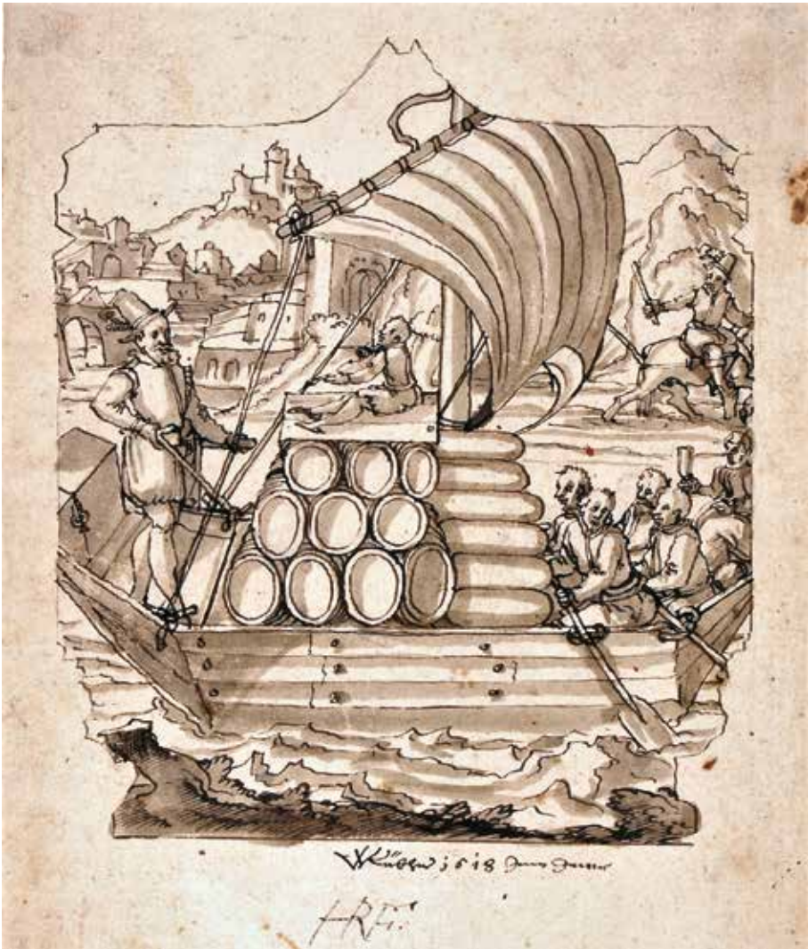
6 Werner Kübler d. J., Lädine beladen mit Weinfässern und Ballen (von Grautuch?), auf der Bergfahrt; im Hintergrund Schaffhausen und Munot (links), treidelnder Rosser (rechts), lavierte Federzeichnung, 1618, „im Jenner“. Museum zu Allerheiligen, Schaffhausen, B 3077.

Hatten die Schiffer den See erreicht, konnten sie die Treidler entlassen und bereits in Stein oder einer anderen Hafenstadt am westlichen Bodenseeufer nochmals 40 Prozent ihrer Ladekapazität nachladen, so lange, bis ihr Schiff «bis zum